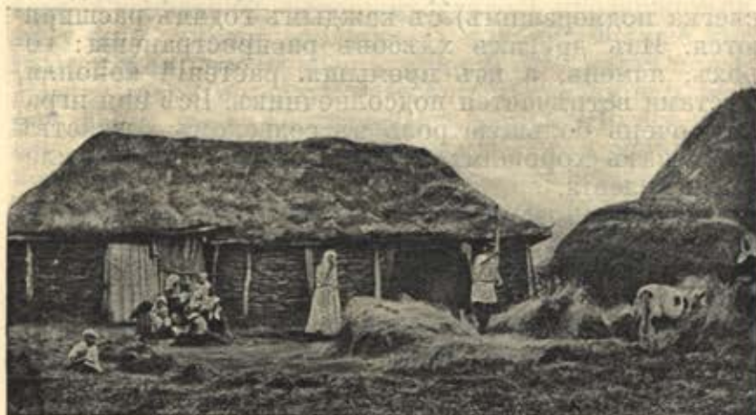
Молотѣба цѣнами въ Орловск. губ.

Соха и борона, какъ и у нашихъ дѣдовъ, продолжаютъ еще нести свою службу, но мѣстами встрѣ-