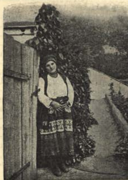
Женщина Тульской губерніи.

улыбнется. Рѣчь свою пересыпаетъ прибаутками, нѣтъ, нѣтъ... да и остренькое словцо вставить, и про сосѣда расскажетъ, и что въ другомъ селѣ дѣлается знаетъ. Въ работѣ скоръ и какъ бы усердно ни занимался своимъ дѣломъ, онъ или поетъ, или рассказываетъ, или, наконецъ, хоть перебрани-