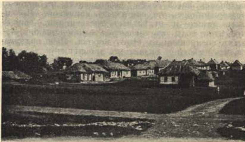
Деревня Орловской губ.

Народное образованіе, или вѣрнѣе грамотность, пользуется большимъ распространеніемъ, и съ каж-