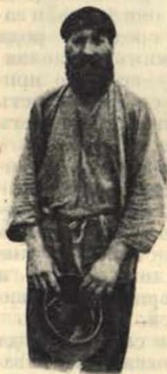
Великоросъ Рязанской губ.

ваются, но въ то же время ни на минуту не прерываютъ своихъ занятій. Въ характерѣ его лежитъ способность легко примѣняться къ какимъ угодно обстоятельствамъ. Онъ не боится приняться за новое, совсѣмъ не знакомое дѣло и съ легкостью и быстротой усваиваетъ его. Пѣсни великоруссы любятъ такія, въ которыхъ бы отражались отвага, сила воли, вопль отчаянія, вообще сильныя движенія души, отчего особымъ почетомъ пользуются старинныя разбойничьи пѣсни.