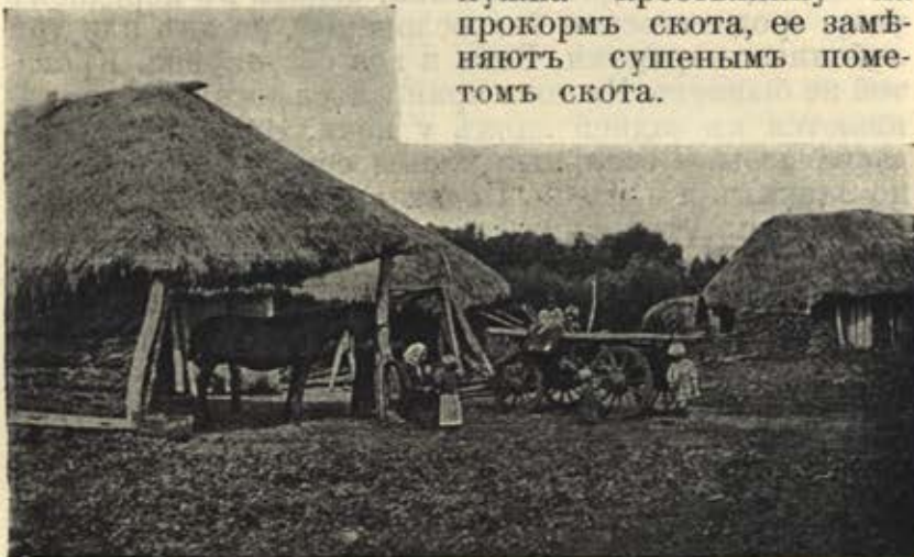
На крестьянск. дворѣ Тульск. губ.

Топливымъ крестьяне не богаты. Негдѣ взять даже и хвороста. Своихъ лѣсовъ крестьяне не имѣютъ, а казенныя и помѣщичьи роци хорошо охраняются. Набравши полныя, татарника и другого бурьяна по дорогамъ, крестьяне употребляютъ его на топливо. А нѣтъ этого, особенно въ зимнее время, приходится топить соломой. Въ голодныя же годы, когда солома нужна крестьянину на прокормъ скота, ее замѣняютъ сушенымъ пометомъ скота.