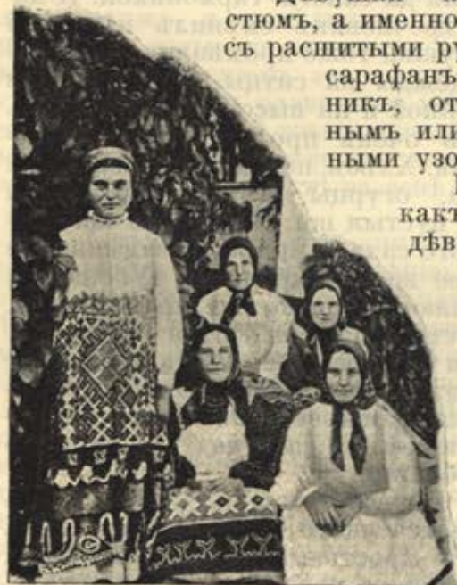
Женщины Рязанской губ.

Женщины носили двѣ косы съ прямымъ проборомъ, прикрывая головку платкомъ или «повойникомъ» такъ назывался головной уборъ изъ холста или другихъ тканей