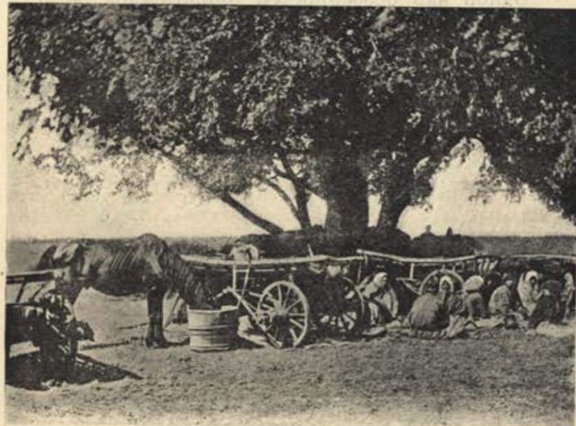
Подъ явой въ обѣдѣ.

И такъ, несмотря на плодородную почву и благодатный климатъ, Черноземная область предста-